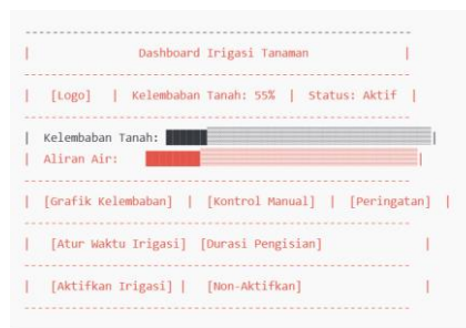
Gambar 4. Rancangan Tampilan Website

Tampilan Graphic User Interface (GUI) untuk sistem irigasi otomatis berbasis IoT dirancang untuk memberikan pengalaman pengguna yang intuitif dan mudah digunakan, seperti yang ditunjukkan pada gambar 4. Dashboard utama menampilkan berbagai elemen penting yang memungkinkan pemantauan dan kontrol sistem secara efisien. Elemen pertama adalah Status Sistem, yang menunjukkan apakah sistem irigasi sedang aktif atau tidak. Di samping itu, terdapat Status Kelembaban Tanah, yang menampilkan informasi kelembaban dalam bentuk persentase dan grafik batang, memberikan gambaran jelas tentang kondisi media tanam. Status Aliran Air juga disertakan, yang menunjukkan apakah aliran air berjalan lancar atau ada masalah dalam sistem irigasi. Untuk kontrol manual, terdapat Kontrol Manual, berupa tombol yang memungkinkan pengguna untuk mengaktifkan atau menonaktifkan pengisian air, serta mengatur durasi irigasi sesuai kebutuhan. Sebagai tambahan, terdapat Grafik Pemantauan Kelembaban, yang menampilkan data kelembaban tanah secara real-time dalam grafik, memungkinkan pemantauan jangka panjang. Pengguna juga dapat menyesuaikan Kontrol Pengaturan Irigasi, mengatur waktu dan durasi pengisian air berdasarkan preferensi mereka. Untuk memastikan sistem bekerja dengan baik, Peringatan dan Notifikasi akan muncul jika kelembaban tanah terlalu rendah atau jika terdeteksi masalah dengan aliran air.