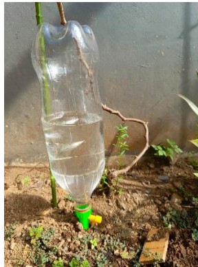
Gambar 1. Sistem Drip Manual

Dalam sistem irigasi tetes otomatis berbasis Internet of Things (IoT) , monitoring kelembaban tanah dan pH tanah sangat penting untuk memastikan kondisi ideal bagi pertumbuhan tanaman. Berikut adalah level kondisi sebenarnya terkait kelembaban tanah dan pH tanah , yang digunakan sebagai acuan untuk mengatur sistem irigasi: