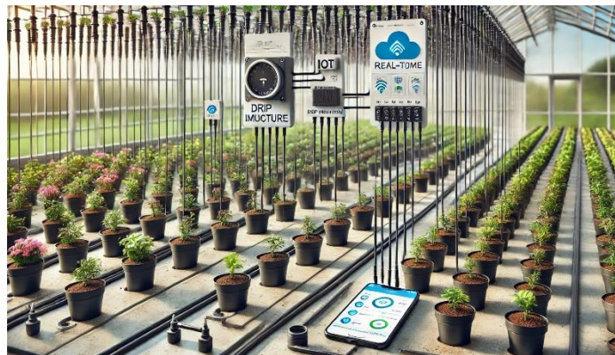
Gambar 2. Planning Sistem Drip Otomatis Berbasis Internet of Things

Hasil perencanaan sistem irigasi tetes otomatis berbasis Internet of Things (IoT) ini bertujuan untuk memenuhi kebutuhan pengguna dalam mengelola kelembaban tanah dan efisiensi pengairan. Perencanaan ini menghasilkan desain sistem yang mencakup sensor kelembaban tanah, mikrokontroler sebagai pusat kendali, aktuator untuk mengatur aliran air, dan antarmuka berbasis web atau mobile untuk pemantauan. Pada Gambar 2, ditampilkan ilustrasi lengkap dari sistem yang dibangun, di mana setiap komponen saling terintegrasi untuk mendukung otomatisasi dan pemantauan jarak jauh. Gambar ini menggambarkan arsitektur sistem mulai dari pengumpulan data sensor hingga kontrol irigasi, sesuai dengan perencanaan sistem yang dirancang untuk memberikan solusi cerdas dan hemat air bagi pengguna.