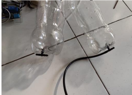
Gambar 7. Rangkaian Selang Pengisian Air

Hasil mekanisme pengisian air pada sistem drip otomatis, seperti yang ditunjukkan pada gambar 7, berhasil menerapkan kontrol otomatis terhadap aliran air untuk mendukung sistem irigasi yang efisien. Pengisian air dimulai ketika sensor kelembaban tanah mendeteksi bahwa tingkat kelembaban di media tanam berada di bawah batas yang telah ditentukan. Dalam keadaan ini, sistem secara otomatis mengaktifkan aktuator solenoid valve yang terhubung dengan pipa aliran air, membuka valve untuk memungkinkan air mengalir ke tanaman. Selama proses ini, sensor aliran air berfungsi untuk memastikan bahwa air mengalir dengan lancar tanpa ada gangguan atau hambatan di jalur irigasi.