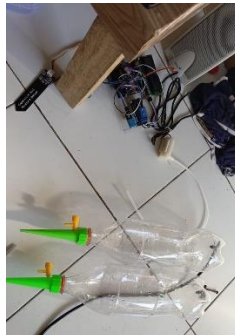
Gambar 6. Hasil Rangkaian Sistem Drip berbasis IoT part 2

Dengan menggunakan modul Wi-Fi seperti ESP32, sistem ini memungkinkan pemantauan dan kontrol jarak jauh, memudahkan pengguna untuk memantau kelembaban tanah, status aliran air, dan mengatur irigasi melalui platform IoT berbasis cloud, seperti Blynk. Grafik pemantauan kelembaban dan pengaturan waktu serta durasi irigasi juga tersedia pada antarmuka pengguna (GUI), yang menampilkan data secara real-time. Selain itu, sistem ini dilengkapi dengan peringatan otomatis untuk memberi tahu pengguna jika kelembaban tanah terlalu rendah atau jika ada masalah dalam aliran air. Hasil implementasi ini menunjukkan bahwa sistem drip otomatis berbasis IoT dapat berfungsi secara efektif dalam mempermudah pengelolaan irigasi tanaman dengan lebih efisien dan berkelanjutan seperti yang ditunjukkan pada Gambar 6.