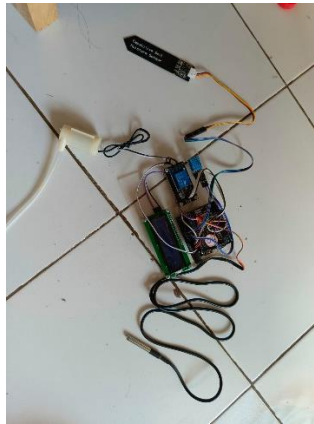
Gambar 5. Hasil Rangkaian Sistem Drip berbasis IoT part 1

Hasil sistem drip otomatis yang dibangun, seperti yang ditunjukkan pada gambar 5, berhasil mengintegrasikan berbagai komponen teknologi untuk menciptakan sebuah sistem irigasi yang efisien dan dapat dikontrol secara otomatis. Sistem ini memanfaatkan sensor kelembaban tanah untuk memantau kondisi media tanam dan sensor aliran air untuk memastikan bahwa air mengalir dengan lancar ke tanaman. Ketika kelembaban tanah terdeteksi rendah, sistem secara otomatis mengaktifkan aktuator solenoid valve untuk membuka aliran air, memberikan pengairan yang diperlukan tanpa intervensi manual. Semua data dari sensor dan status aktuator dikirimkan ke server melalui microcontroller (seperti ESP32 atau Arduino), yang juga berfungsi sebagai penghubung antara sistem dengan jaringan IoT.