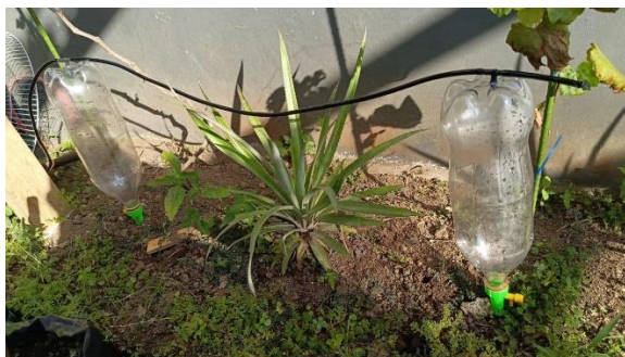
Gambar 8. Pengisian Air pada Sistem Drip

Pengaturan durasi dan waktu pengisian air dapat dilakukan melalui antarmuka pengguna (GUI) ditunjukkan pada Gambar 8, memungkinkan pengguna untuk menyesuaikan durasi pengairan berdasarkan kebutuhan tanaman atau kondisi lingkungan. Setelah durasi yang ditentukan tercapai atau kelembaban tanah sudah mencukupi, solenoid valve secara otomatis menutup untuk menghentikan aliran air. Sistem ini tidak hanya memastikan bahwa tanaman menerima jumlah air yang cukup, tetapi juga mengoptimalkan penggunaan sumber daya air dengan menghindari pemborosan. Penerapan mekanisme pengisian air yang terintegrasi dengan teknologi IoT ini memastikan pengelolaan irigasi yang lebih efisien, mengurangi intervensi manual, dan meningkatkan hasil pertanian secara berkelanjutan.